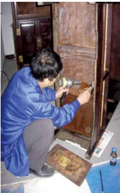
北京艺术博物馆委托市文物古建工程公司开展馆藏明清家具修复工作