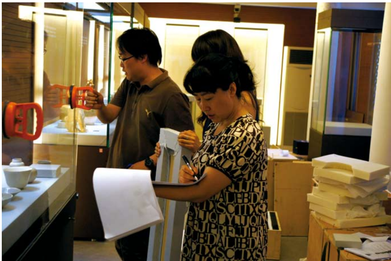
保管信息部同志正在进行《唐风一脉——巩义窑陶瓷艺术展》的布展工作

龙泉务窑出土的瓷器（片）逾百万，划拨北京艺术博物馆收入馆藏，极大的丰富了馆藏文物的数量。