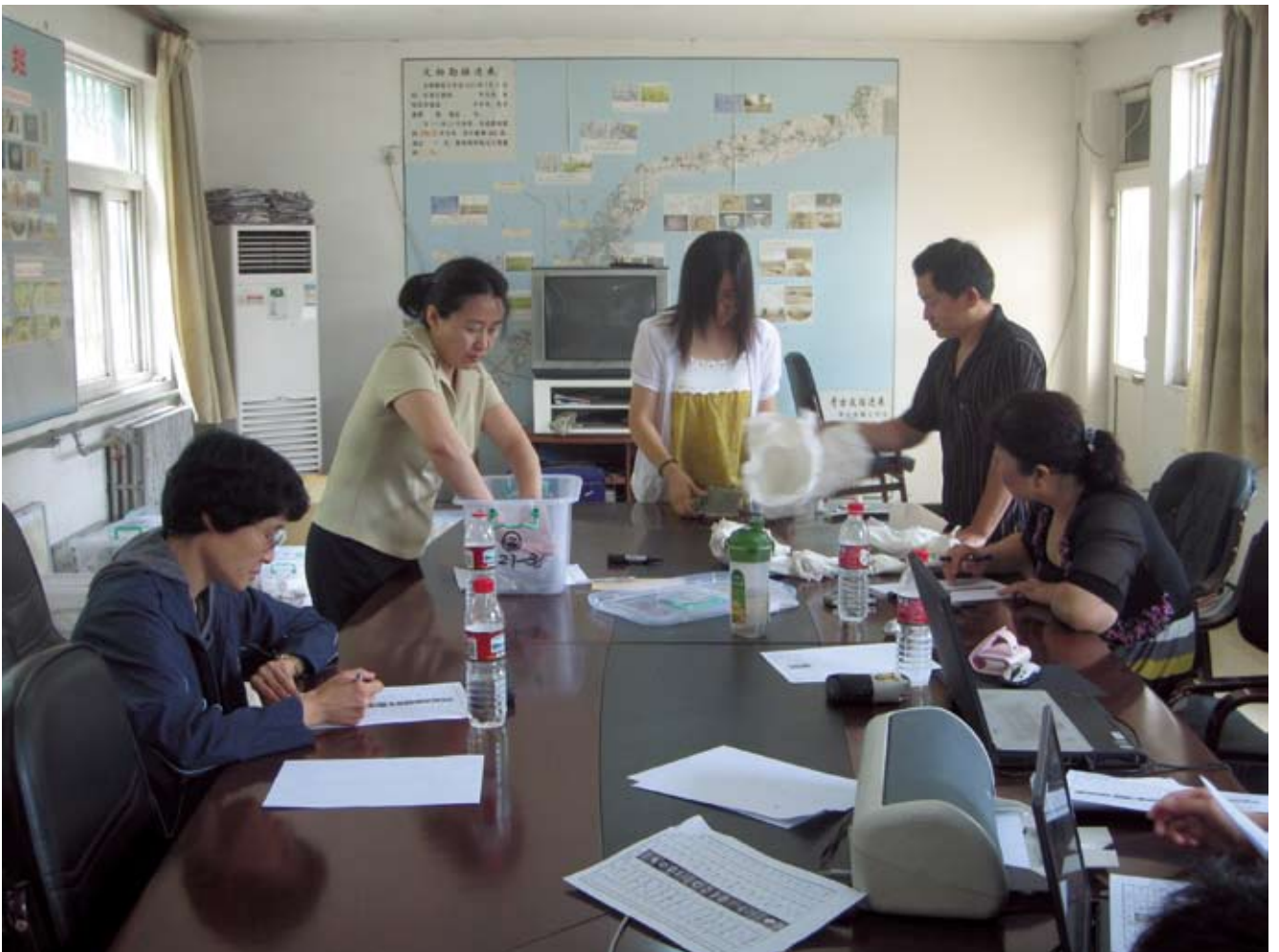
我馆与北京市文物研究所进行毛家湾出土瓷片的交接工作