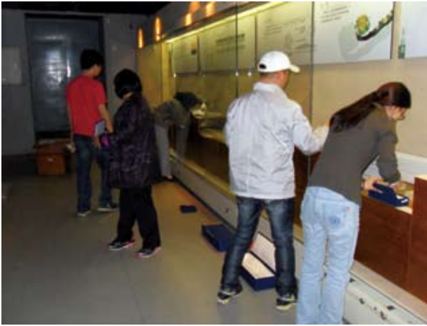
保管信息部同志正在进行《明清工艺品展》的撤展工作