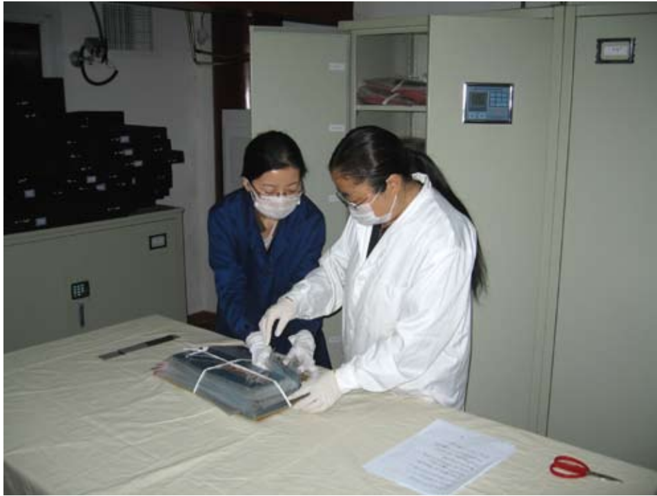
新配备的恒温恒湿文物柜，专门用于保存馆藏丝织品