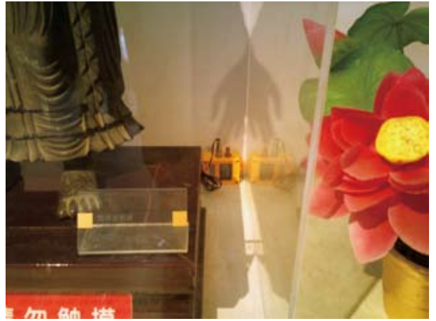
《佛教艺术展》中配备的温湿度检测仪