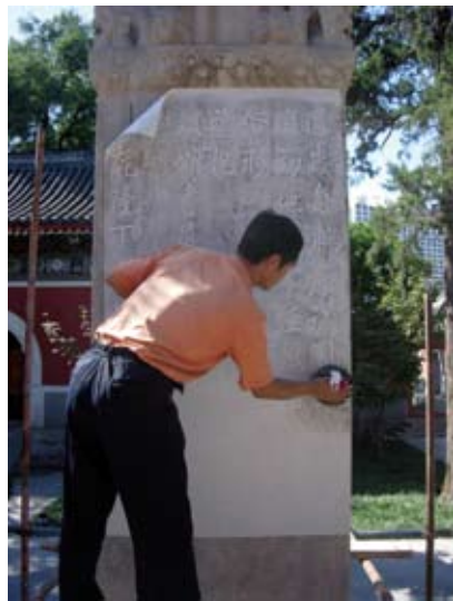
2006年我馆开展的石碑修复工作，工作人员正在对大延寿殿前乾隆时期石碑进行拓片，保存碑文原貌