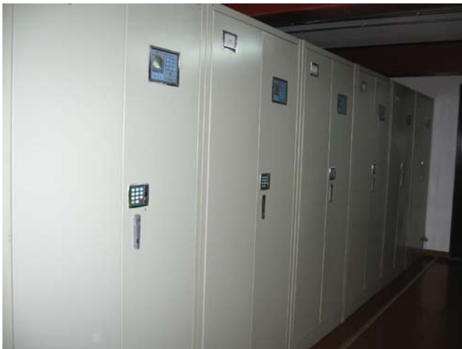
保管信息部文物排架