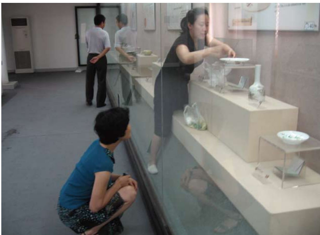
保管信息部同志正在对展厅文物进行维护保养