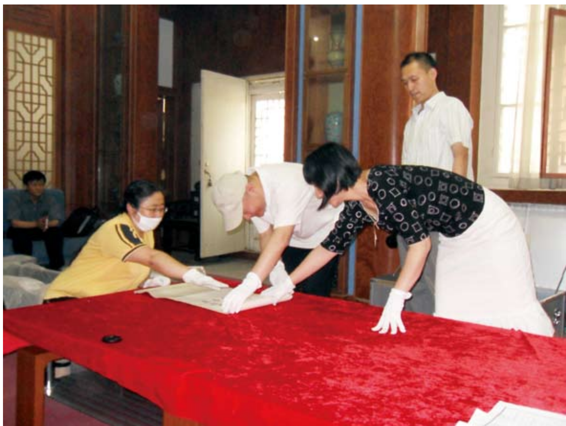
2010年我馆与辽金城垣博物馆进行《民国政要书画展》的文物点交工作