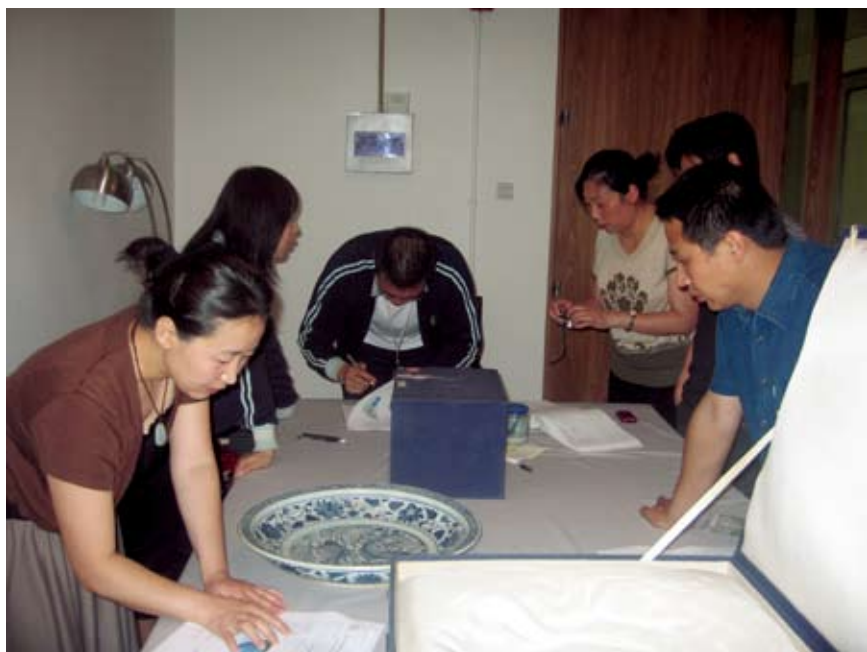
2009年我馆与首都博物馆、外省博物馆进行《青花的记忆——元代青花瓷文化展》的文物点交工作

北京艺术博物馆收藏各类文物艺术品近十万件。馆藏中国古代艺术品以传世品为主，时代上起原始社会，下迄近现代，尤以明清时期的藏品蔚为大观，门类涉及书画、碑帖、织绣、陶瓷器、玉石器、青铜器、竹木牙角漆器、钱币、邮票、印章、家具等。除古代艺术品外，馆内还收藏了吴昌硕、齐白石、张大千、徐悲鸿等近现代中国艺术大师的传世之作。此外，博物馆还收藏了以日本艺术品为主要藏品的外国艺术品。2011年，北京市文物局将毛家湾出土瓷器（片）、