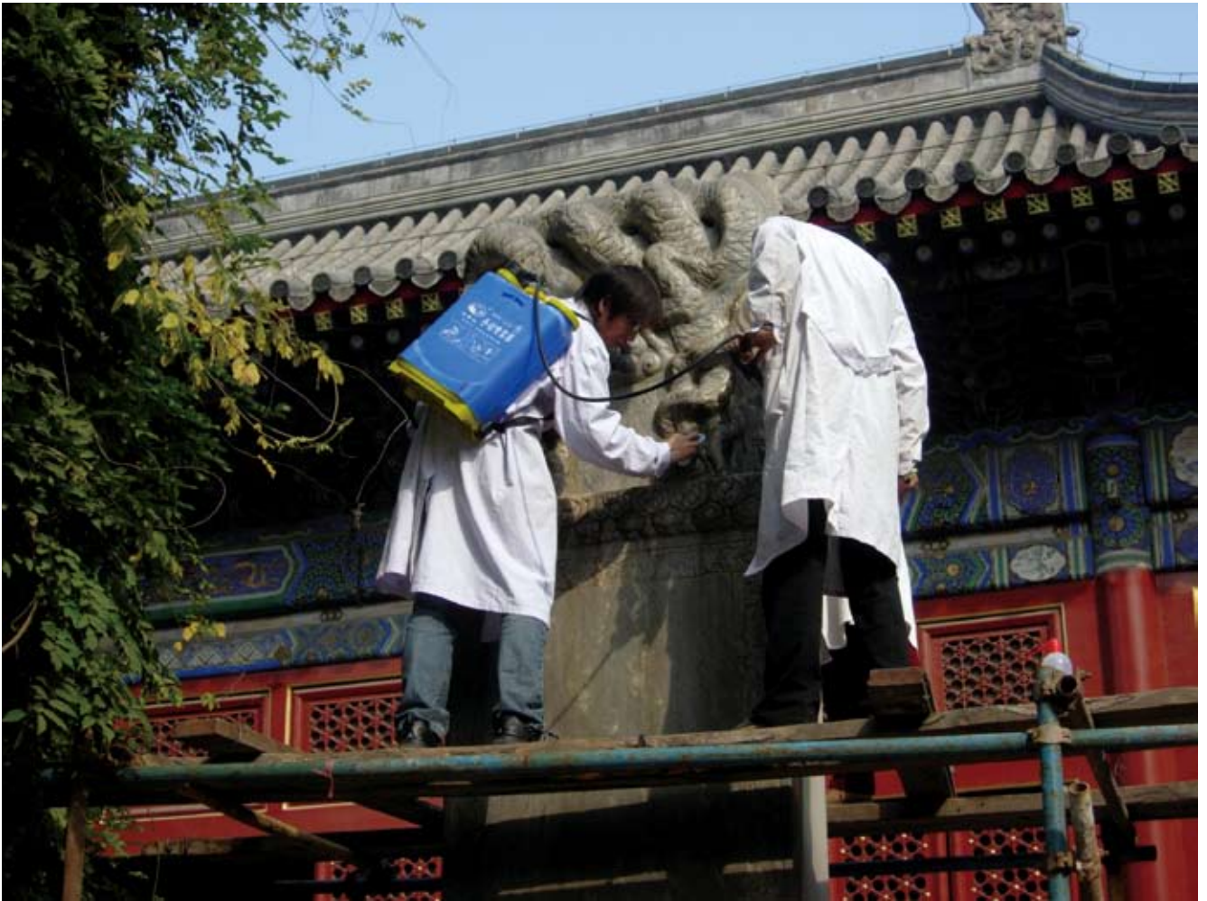
在我馆2006年开展的石碑修复工作中，工作人员正在对大延寿殿前乾隆时期石碑喷涂防水试剂